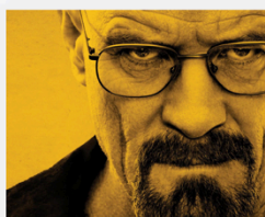
Highlight small 960x780 (smartphone)