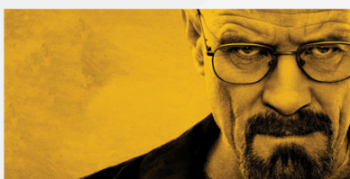
Highlight medium 2304x1152 (tablet)