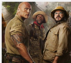
Hero small 960x840 (smartphone)