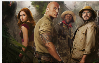
Hero medium 2304x1440 (tablet)