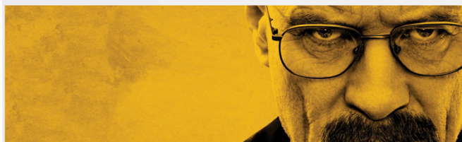
Highlight large 4320x1299 (desktop)