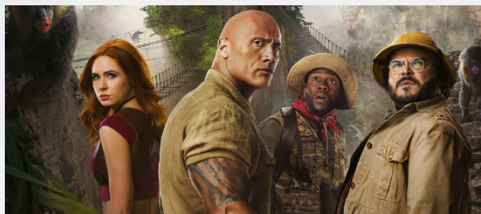
Hero large 4320x1890 (desktop)